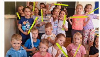
SPOTKANIE Z POLICJANTEM I RATOWNIKAMI MEDYCZNYMI