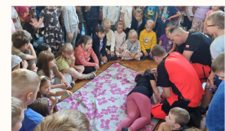
SPOTKANIE Z POLICJANTEM I RATOWNIKAMI MEDYCZNYMI